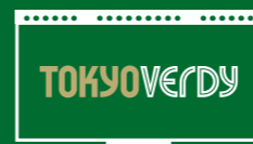
スタジアムボードに掲載