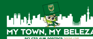
オリジナルロゴ・呼称使用権