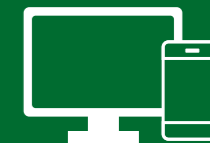
ベレーザ公式 WEB ページに掲載