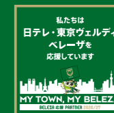
応援パートナー加盟ステッカー