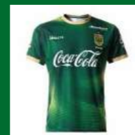
オリジナルユニフォーム